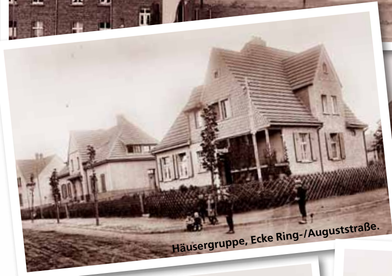
Häusergruppe, Ecke Ring-/Auguststraße.