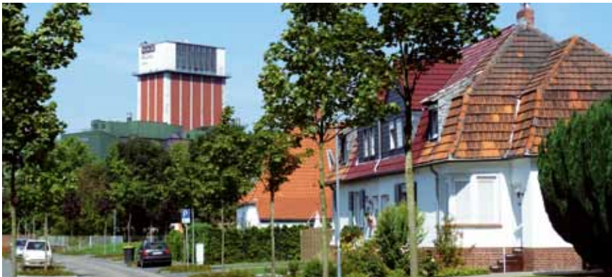
Blick auf den Förderturm heute.

Insgesamt fünf Jahre dauerte die Erschließung der Arbeiterkolonie mit Erdgas. Teilweise gab es in dieser Zeit mehr als 400 Neuanschlüsse jährlich im gesamten Stadtgebiet. Heute versorgen die Stadtwerke allein in der Altsiedlung rund 50 Prozent der Haushalte mit Erdgas. Im Vergleich zur Kohleheizung von damals ein gigantischer Gewinn für die Umwelt, denn durch die Umstellung gelangen heute pro Jahr acht Tonnen CO 2 weniger in die Luft – und das pro angeschlossenem Haushalt! Die Menschen in der größten zusammenhängenden Bergbausiedlung des Ruhrgebiets spüren das und leben nirgendwo lieber als in „ihrer Kolonie“.