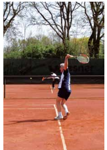
Tennisplatzeröffnung am 10. April 2011.

dadurch auch langjährige Mitglieder. Und obwohl die Zahl von 2007 bis 2011 von 172 auf 158 Mitglieder leicht zurückgegangen ist, ist die Zahl der aktiven Spieler real gestiegen.