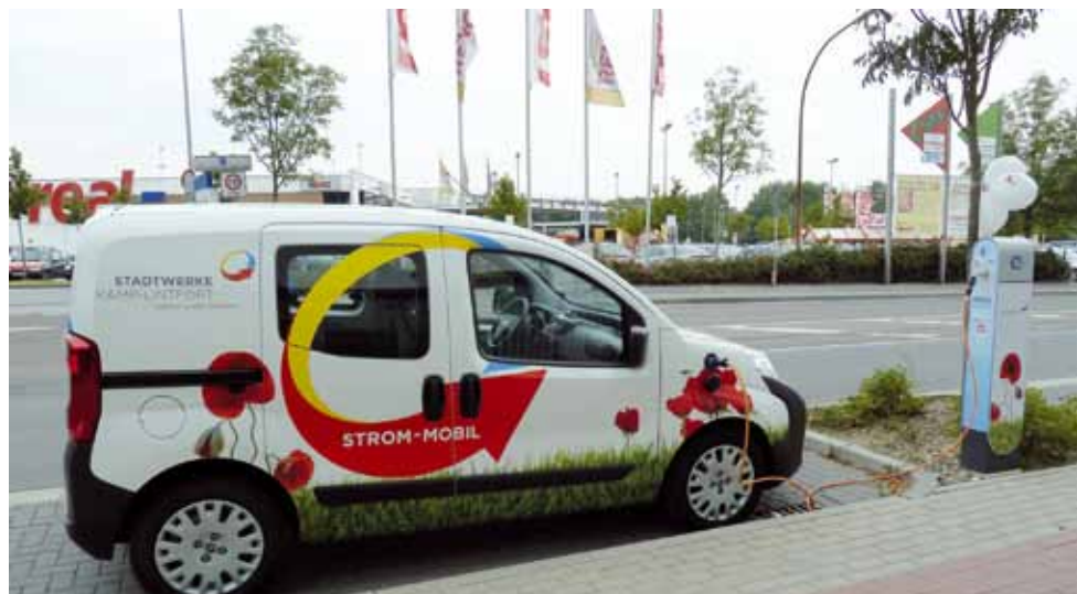
Auch das Strom-Mobil der Stadtwerke Kamp-Lintfort tankt an einer der Ladesäulen auf.