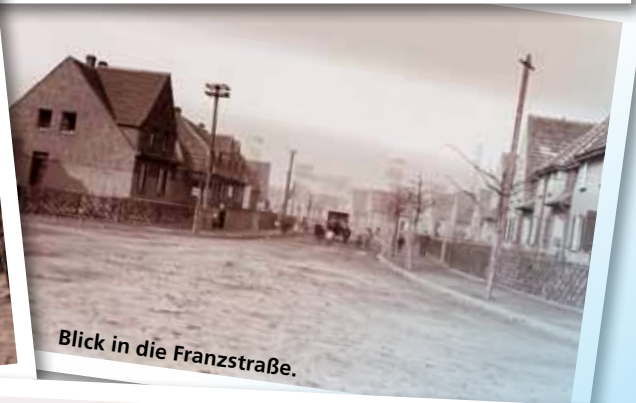
Blick in die Franzstraße.