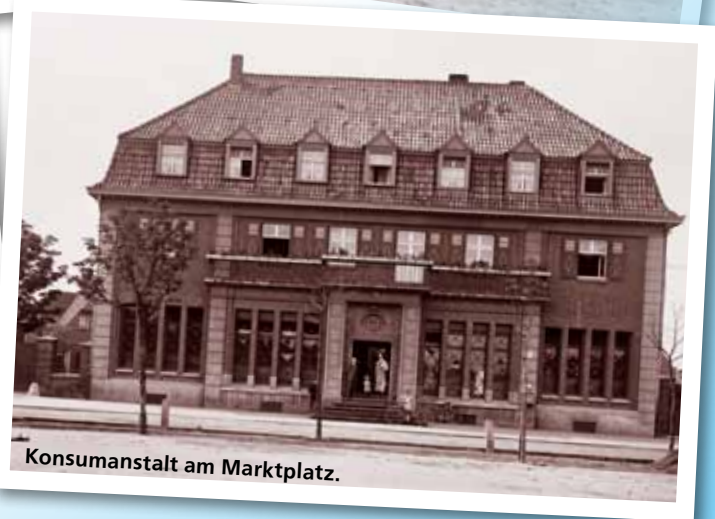
Konsumanstalt am Marktplatz.