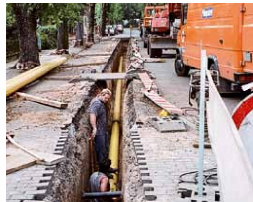
Verlegung einer Gasleitung Ende der 1990er Jahre.