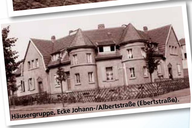
Häusergruppe, Ecke Johann-/Albertstraße (Ebertstraße).