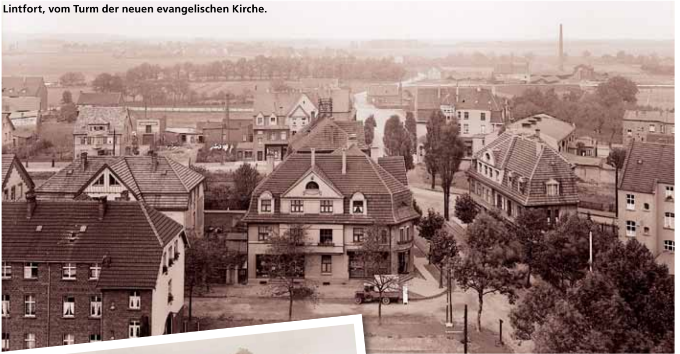
Lintfort, vom Turm der neuen evangelischen Kirche.